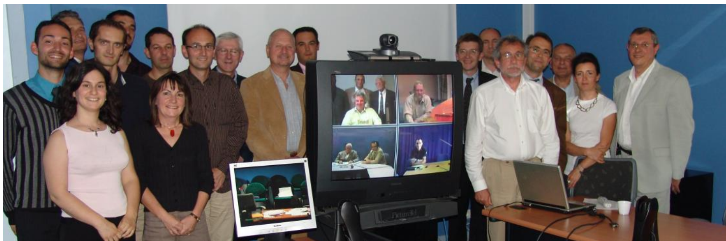
Associés de la SCIC Catel Accompagnement - photo prise lors de l'Assemblée Générale de constitution de la SCIC Catel Accompagnement du 18 juin 2008.